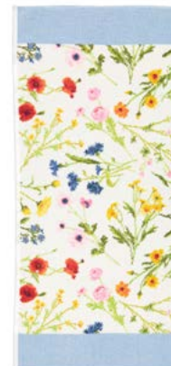
FLOWER MEADOW Farben: gelb, breeze colours: yellow, breeze