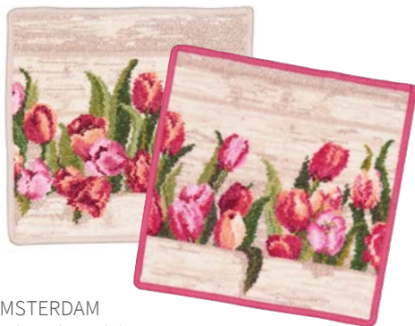
AMSTERDAM Farben: kiesel, karminrot colours: pebble, carmine red