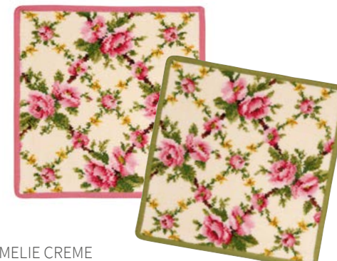
AMELIE CREME Farben: himbeere, moos colours: raspberry, moss