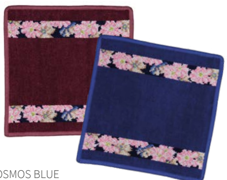
COSMOS BLUE Farben: weinrot, blau colours: wine red, blue