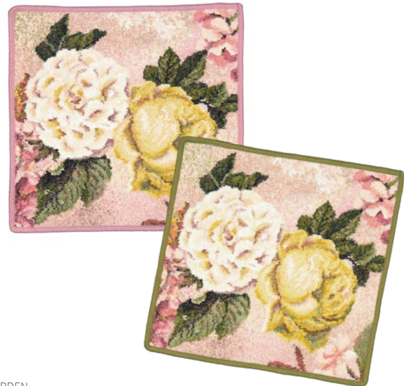
SECRET GARDEN Farben: altrosa, oliv colours: old rose, olive green