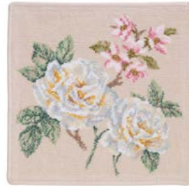
VANILLA ROSE Farbe: muschel colour: seashell