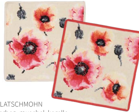
KLATSCHMOHN Farben: muschel, koralle colours: seashell, coral