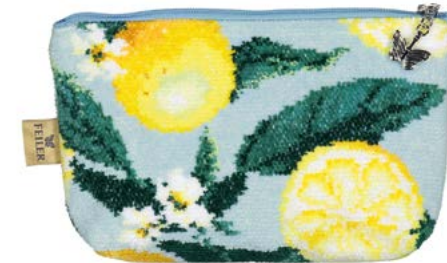
LEMONS AND LEAVES M4