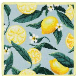
LEMONS AND LEAVES Farbe: zitrone colour: lemon