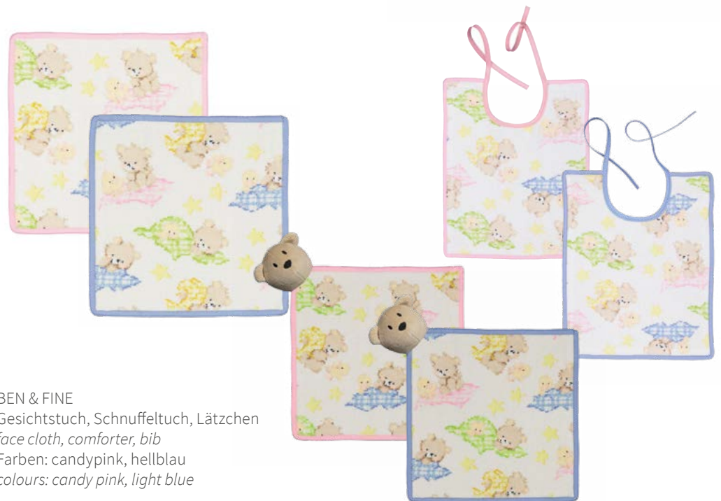
BEN & FINE Gesichtstuch, Schnuffeltuch, Lätzchen face cloth, comforter, bib Farben: candypink, hellblau colours: candy pink, light blue