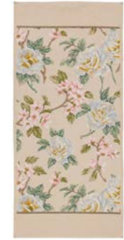
VANILLA ROSE Farbe: muschel colour: seashell