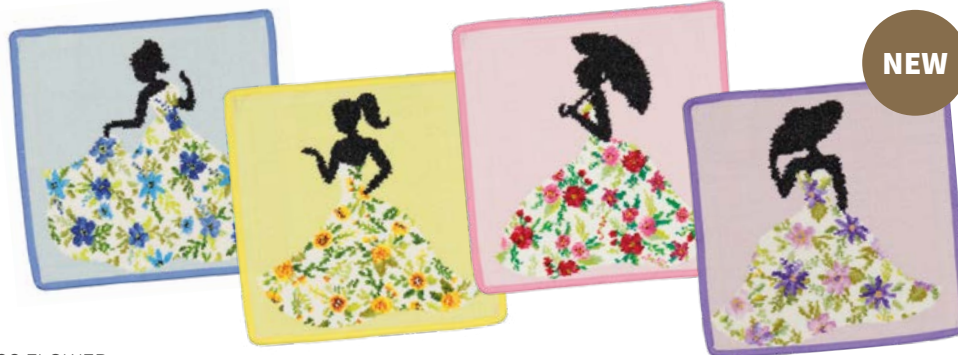
MISS FLOWER Farben: jeansblau, gelb, himbeere, veilchen colours: jeans, yellow, raspberry, violet