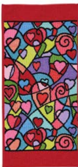
HEARTBEAT Farbe: rot colour: red