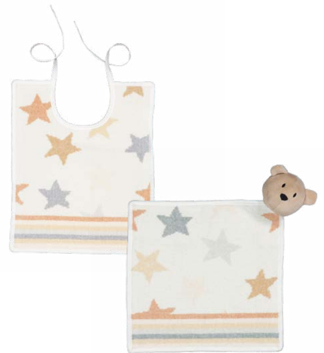
STARS & STRIPES Gesichtstuch, Lätzchen, Schnuffeltuch face cloth, bib, comforter Farbe: weiß colour: white