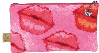
KISS ME M10