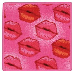
KISS ME Farbe: rosa colour: rose