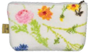
FLOWER MEADOW M4