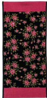
MIRIAM SCHWARZ Farbe: kirsch colour: cherry