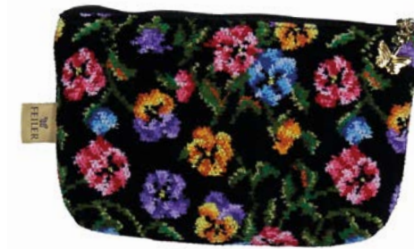
FATIMA PETITE M4