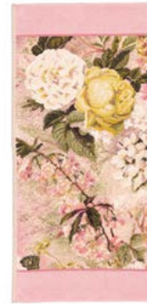
SECRET GARDEN Farbe: puder - altrosa colour: powder - old rose