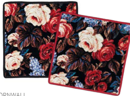
CORNWALL Farben: schwarz, bordeaux colours: black, bordeaux