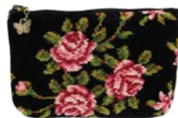
MIRIAM SCHWARZ M4