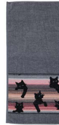
BLACK KITTY Farben: altrosa, grau colours: old rose, grey