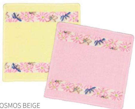
COSMOS BEIGE Farben: zitrone, candypink colours: lemon, candy pink