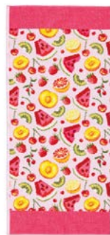
FRUIT POTPOURRI Farbe: azalee colour: azalea