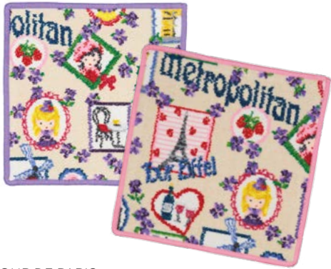
TOUR DE PARIS Farben: veilchen, himbeere colours: violet, raspberry