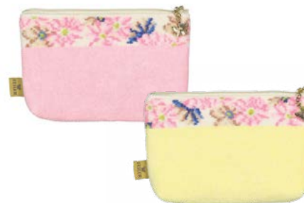
COSMOS BEIGE M8 Farben: candypink, zitrone colours: candy pink, lemon