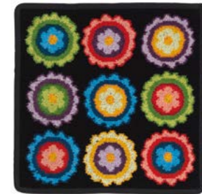
RAINBOW BUTTON Farbe: schwarz colour: black