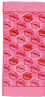
KISS ME Farbe: rosa colour: rose