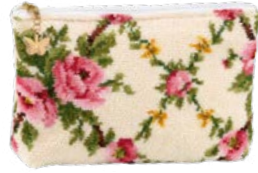
AMELIE CREME M4