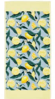
LEMONS AND LEAVES Farbe: zitronen colour: lemon