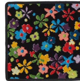
RAINBOW BLOSSOM Farbe: schwarz colour: black