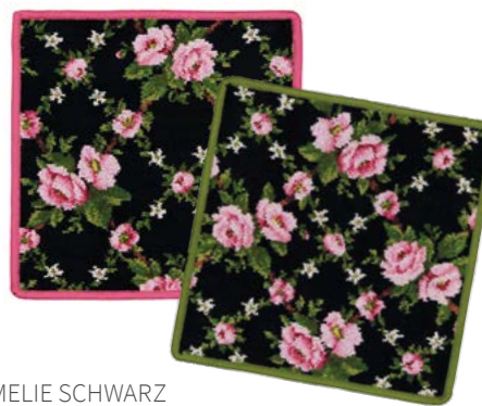
AMELIE SCHWARZ Farben: cerise, waldgrün colours: cerise, forest green