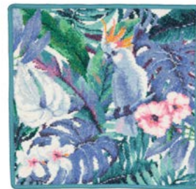
TROPICAL BIRD Farbe: seegrün colour: sea green