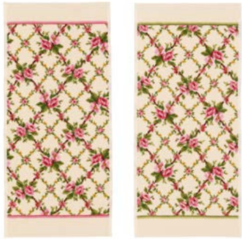
AMELIE CREME Farben: creme - himbeere, creme - moos colours: creme - raspberry, cream - moss