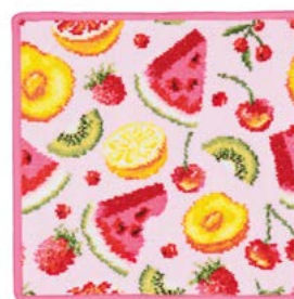
FRUIT POTPOURRI Farbe: azalee colour: azalea