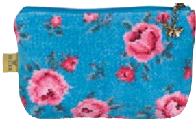
MON PETIT BLEU M4