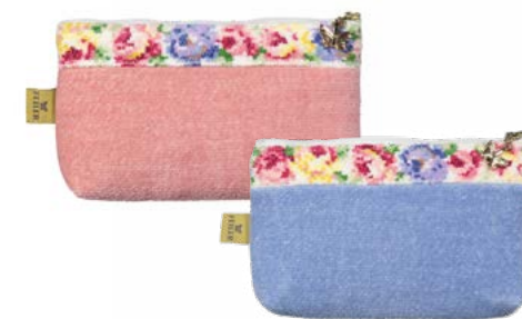
AIDA WEISS M8 Farben: altrosa, hellblau colours: old rose, light blue