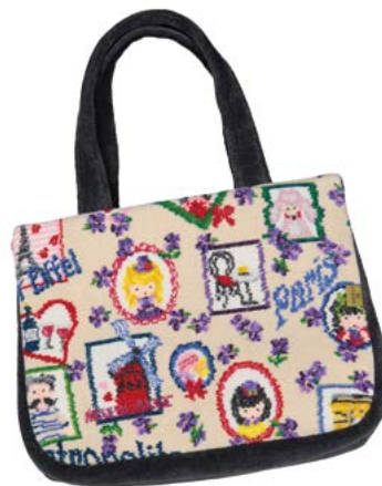
TOUR DE PARIS