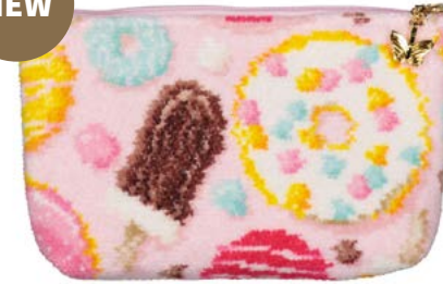
PINK AND SWEET M4