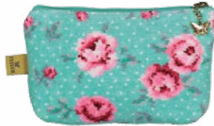
MON PETIT VERT M4