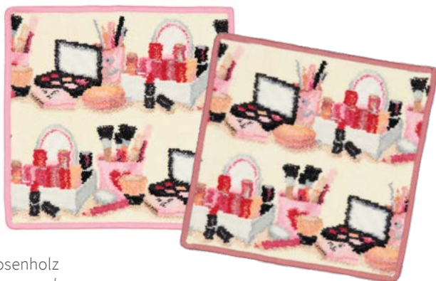
BELLA Farben: himbeere, rosenholz colours: raspberry, rosewood