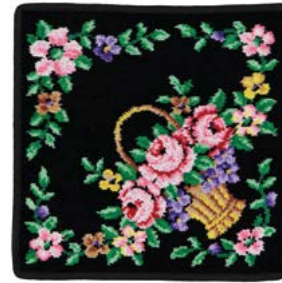
BASKET SCHWARZ Farbe: schwarz colour: black