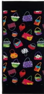
CRAZY BAGS Farbe: schwarz colour: black