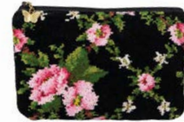
AMELIE SCHWARZ M4