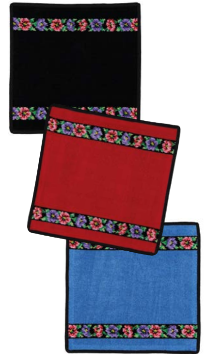
ANEMONE SCHWARZ Farben: schwarz, rot, jeansblau colours: black, red, jeans