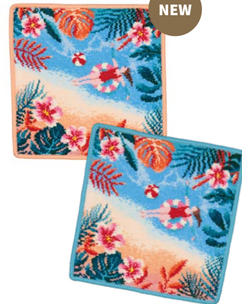
PLAYA TROPICAL Farben: apricot, seegrün colours: apricot, sea green