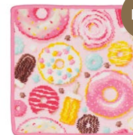
PINK AND SWEET Farbe: himbeere colour: raspberry