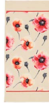
KLATSCHMOHN Farbe: muschel - coralle colour: seashell - coral