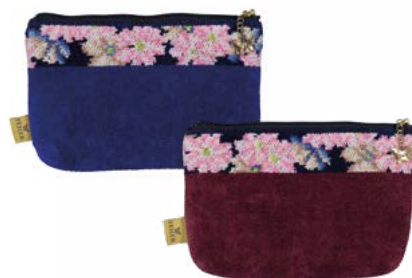
COSMOS BLUE M8 Farben: blau, weinrot colours: blue, wine red