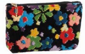
RAINBOW BLOSSOM M4