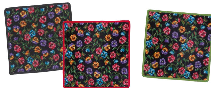
FATIMA PETITE Farben: schwarz, rot, wiesengrün colours: black, red, grass green