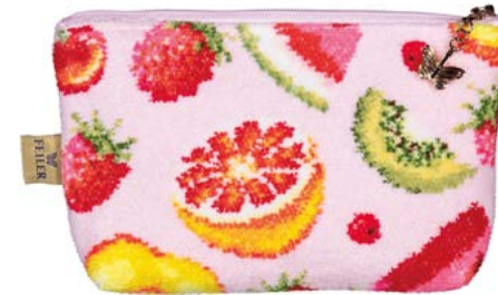
FRUIT POTPOURRI M4