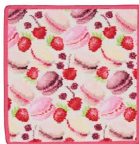
MACARONS BEIGE Farbe: pink colour: pink