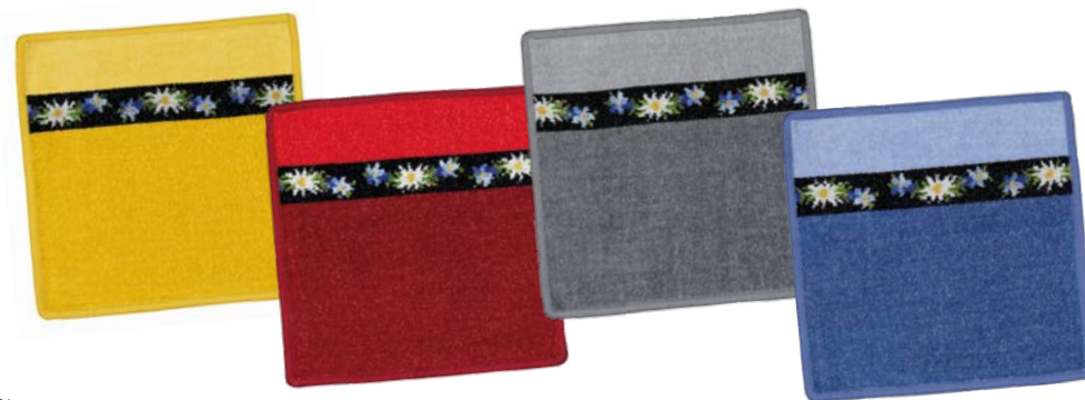
LIESL Farben: messing, bordeaux, grau, rauchblau colours: brass, bordeaux, grey, smoke blue