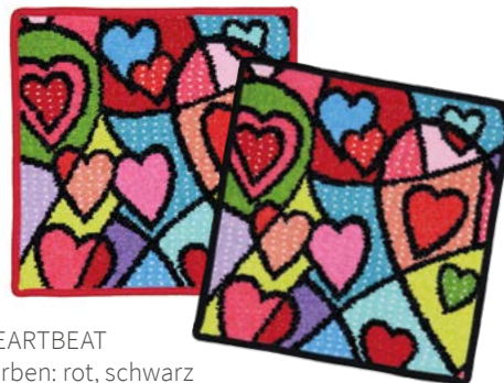
HEARTBEAT Farben: rot, schwarz colours: red, black