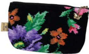
MOHN SCHWARZ M4