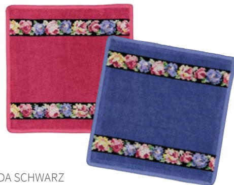
AIDA SCHWARZ Farben: kirsch, rauchblau colours: cherry, smoke blue