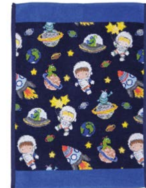
GALAXY STAR Gesichtstuch, Handtuch face cloth, hand towel Farbe: keramblau colour: ceram blue