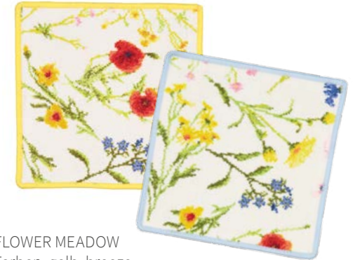
FLOWER MEADOW Farben: gelb, breeze colours: yellow, breeze