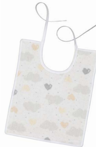
LOVELY SKY Gesichtstuch, Lätzchen face cloth, bib Farbe: weiß colour: white