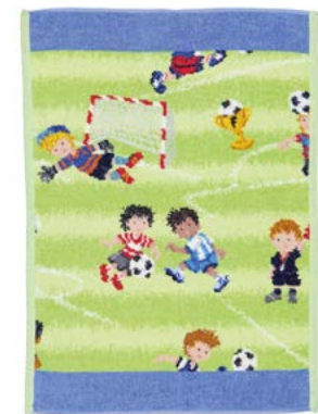
SOCCER Gesichtstuch, Handtuch face cloth, hand towel Farbe: jeansblau colour: jeans blue