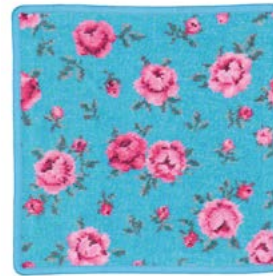
MON PETIT BLEU Farbe: cyan colour: cyan