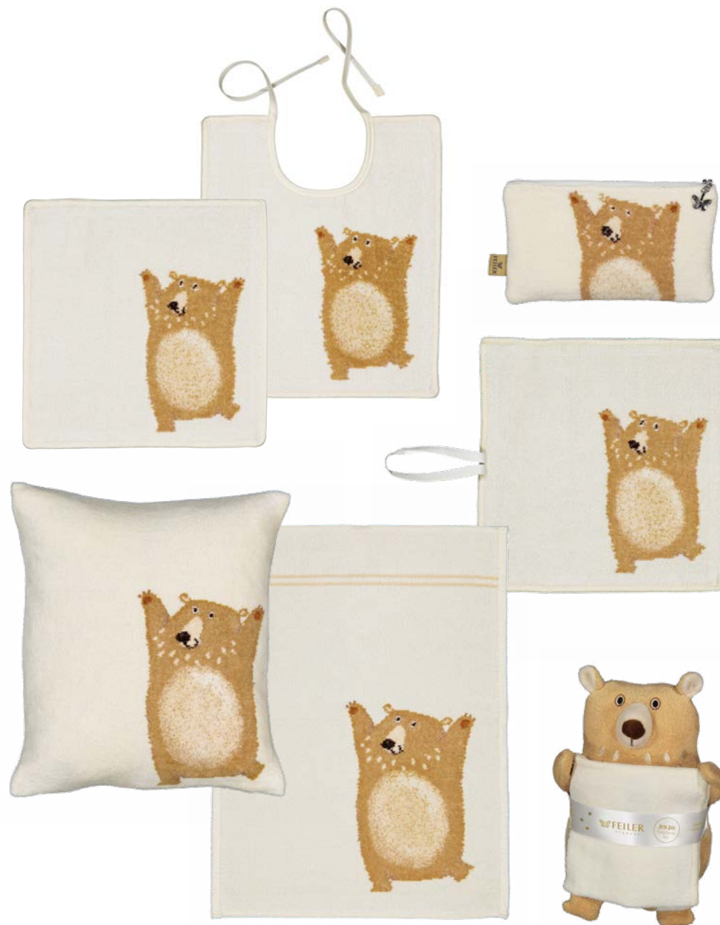
BEN BÄR Gesichtstuch, Lätzchen, Schnullertuch, Handtuch, Kissenbezug, M10, Stofftier face cloth, bib, pacifier cloth, hand towel, cushion cover, M10, soft toy Farbe: beige colour: beige