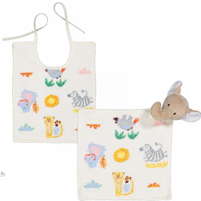
WILD SAFARI Gesichtstuch, Lätzchen, Schnuffeltuch face cloth, bib, comforter Farbe: beige colour: beige