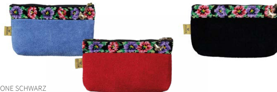
ANEMONE SCHWARZ M8 Farben: jeansblau, rot, schwarz colours: jeans, red, black