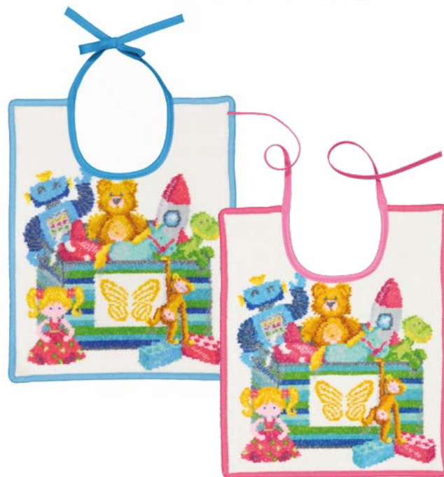
TOY BOX 2.0 Gesichtstuch, Lätzchen face cloth, bib Farben: aqua, pink colours: aqua, pink