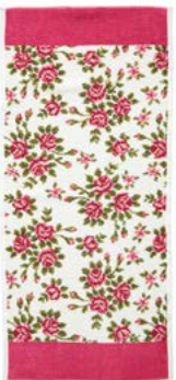
MIRIAM WEISS Farbe: kirsch colour: cherry