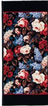
CORNWALL Farbe: schwarz-bordeaux colour: black-bordeaux