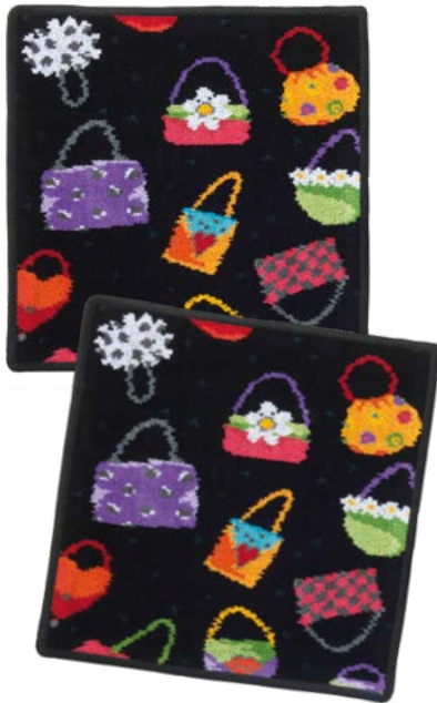
CRAZY BAGS Farbe: schwarz colour: black