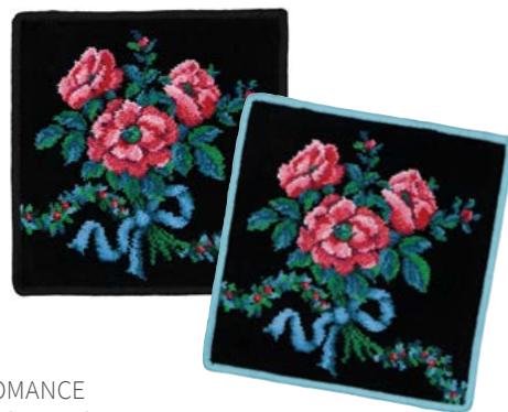
ROMANCE Farben: schwarz, seegrün colours: black, sea green

Chenille / chenille 100 % Baumwolle / cotton Gesichtstuch / face cloth 25 x 25 cm