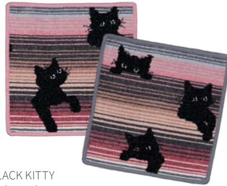
BLACK KITTY Farben: altrosa, grau colours: old rose, grey