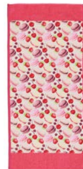
MACARONS BEIGE Farbe: pink colour: pink