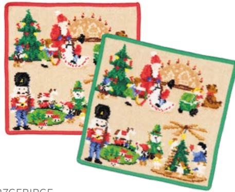
ERZGEBIRGE Farben: rot, flaschengrün colours: red, bottle green