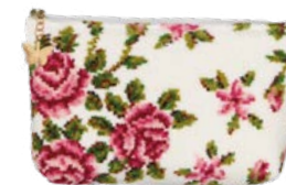
MIRIAM WEISS M4