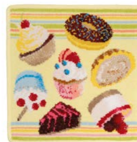
CUPCAKES Farbe: zitrone colour: lemon