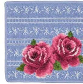
DIRNDL ROSE BLUE Farbe: hellblau colour: light blue