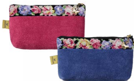
AIDA SCHWARZ M8 Farben: kirsch, rauchblau colours: cherry, smoke blue