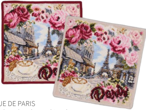
RUE DE PARIS Farben: bordeaux, kiesel colours: bordeaux, pebble