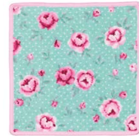
MON PETIT VERT Farbe: candypink colour: candy pink