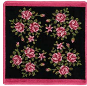
MIRIAM SCHWARZ Farbe: kirsch colour: cherry