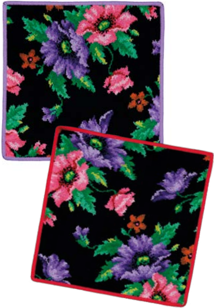
MOHN SCHWARZ Farben: veilchen, rot colours: violet, red