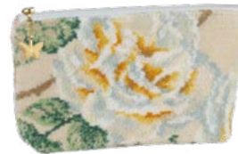
VANILLA ROSE M4