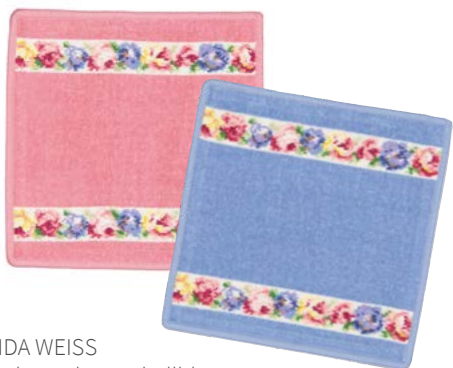
AIDA WEISS Farben: altrosa, hellblau colours: old rose, light blue