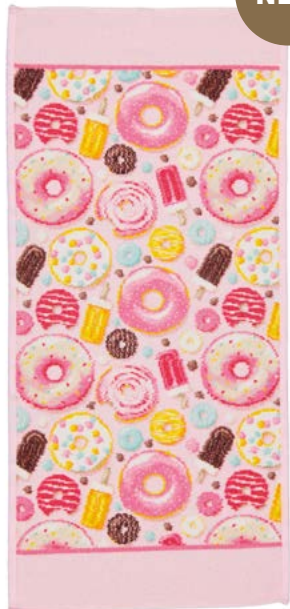
PINK AND SWEET Farbe: rose colour: tender rose