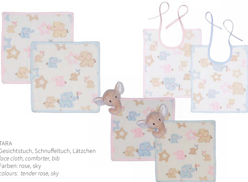
TARA Gesichtstuch, Schnuffeltuch, Lätzchen face cloth, comforter, bib Farben: rose, sky colours: tender rose, sky