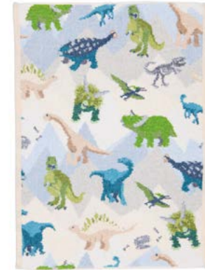
JURASSIC Gesichtstuch, Handtuch face cloth, hand towel Farbe: muschel colour: seashell