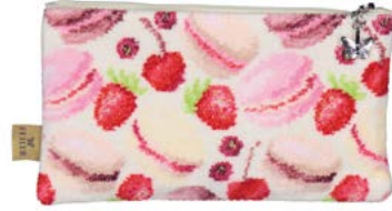
MACARONS BEIGE M10