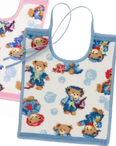
LITTLE SKIPPERS Gesichtstuch, Lätzchen face cloth, bib Farben: erika, hellblau colours: erica, light blue