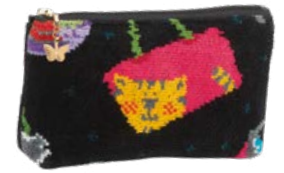
CRAZY BAGS M4