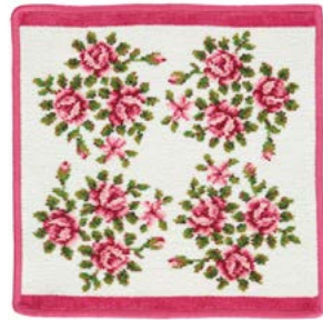
MIRIAM WEISS Farbe: kirsch colour: cherry