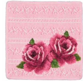
DIRNDL ROSE PINK Farbe: erika colour: erica