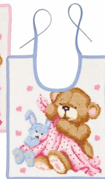
MAX & LINE Gesichtstuch, Lätzchen face cloth, bib Farben: candypink, hellblau colours: candy pink, light blue